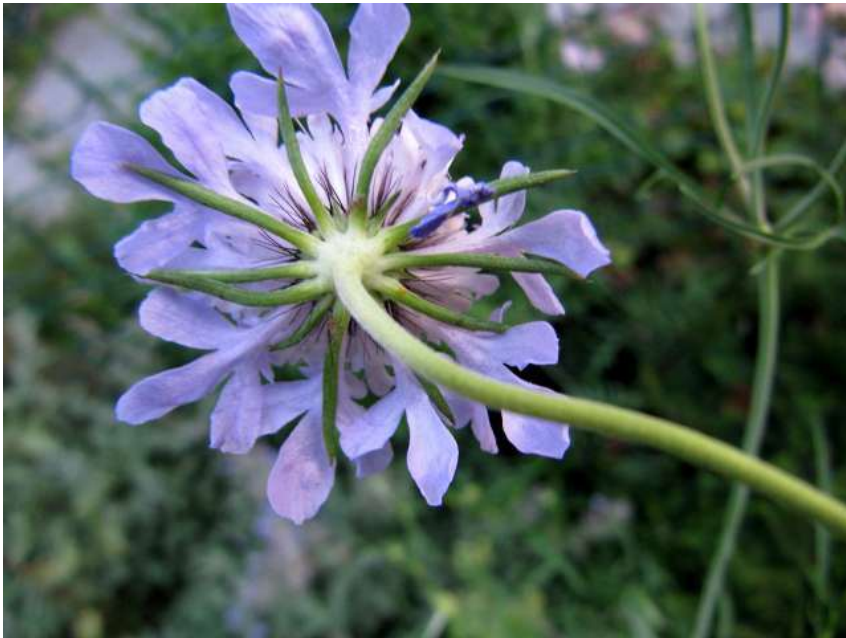
Duifkruid ( Scabiosa columbaria )