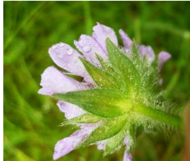
Beemdkroon ( Knautia arvensis )